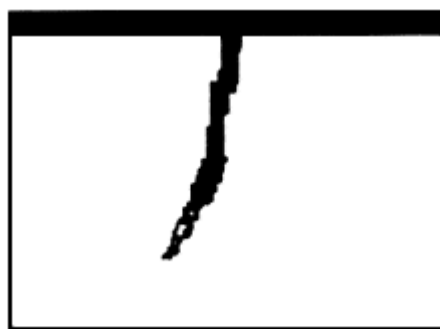
б) нанесение пенетранта

Очистка может осуществляться: промывкой и протиркой с применением воды, моющих составов и легколетучих жидких растворителей; струей абразивного материала; механической обработкой поверхности (шлифование, полирование, шабровка, зачистка щеткой и т.д.).