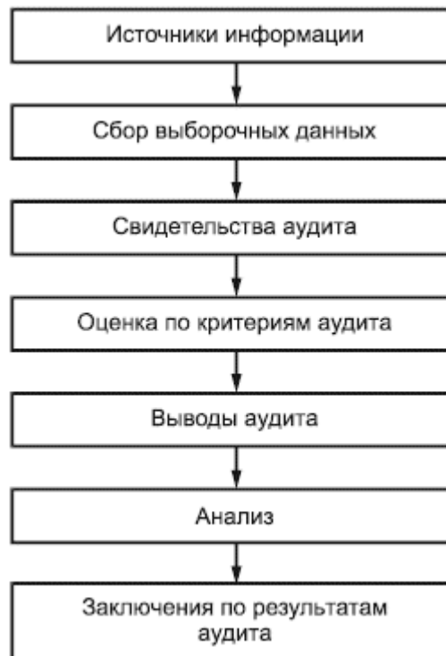
Рисунок 3 - Блок-схема процесса, начиная от сбора информации до получения заключений по результатам аудита