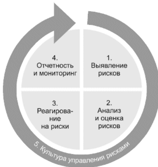
Рисунок 1 - Процесс менеджмента риска