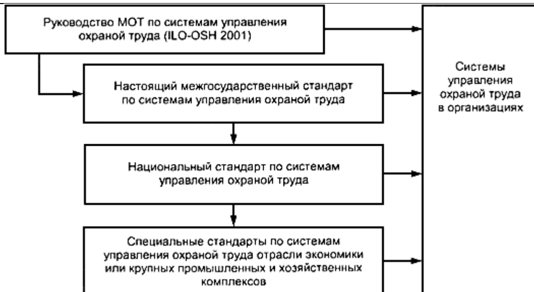
Рисунок 1 - Элементы национальных структур систем управления охраной труда