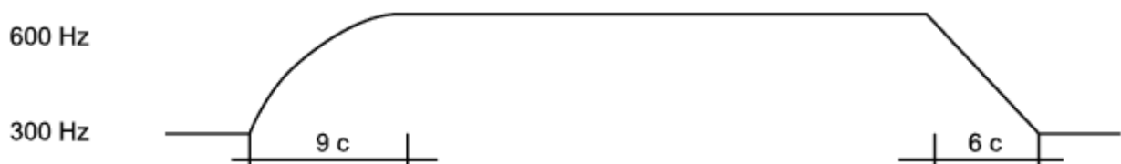
Рисунок 1 - Диаграмма однотонального режима звучания