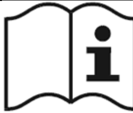
Рисунок 3 - Пиктограмма